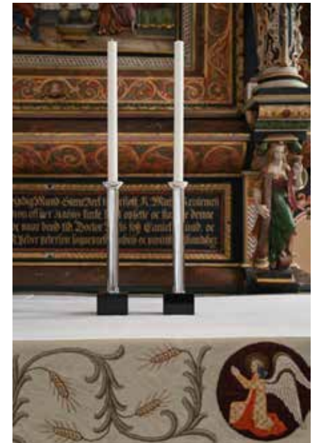
Silversmed, Björn Flygare

www.flygare.m.se bjorn@flygare.m.se +46 (0)705 91 75 83