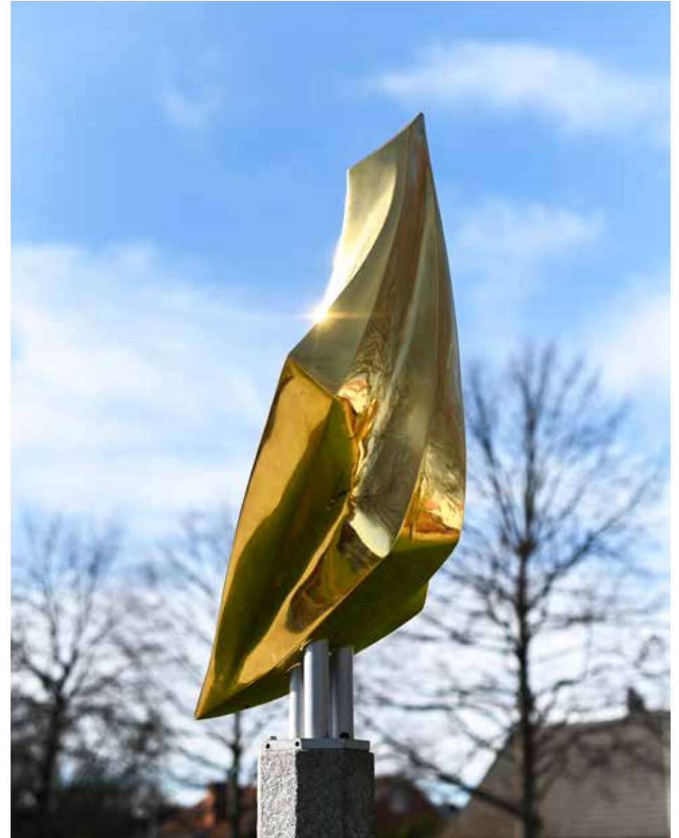
Skulptör, Folke Truedsson