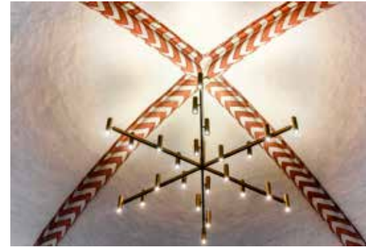
Belysning uppåt och nedåt